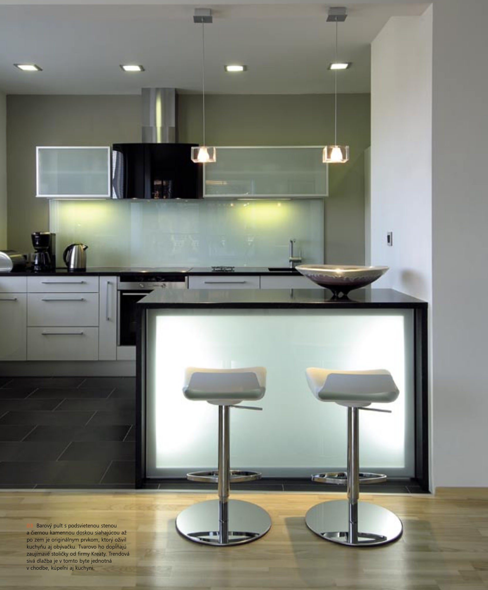
03 Barový pult s podsvietenou stenou a čiernou kamennou doskou siahajúcou až po zem je originálnym prvkom, ktorý oživil kuchyňu aj obývačku. Tvarovo ho dopĺňajú zaujímavé stoličky od firmy Kreaty. Trendová sivá dlažba je v tomto byte jednotná v chodbe, kúpeľni aj kuchyni.